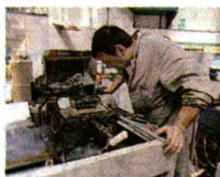
Un campione tutto di Pmi quello di Net Consulting

nello Sviluppo sui mercati esteri le aziende del panel si sono fermate al 35% rispetto al 46% della media nazionale. E il Focus sul mercato è stato indicato come reazione alla crisi dal 29% del panel rispetto al 35% della media nazionale. Una discrepanza che si spiega proprio in virtù del maggior peso dell'industria (e anche alla prevalenza di territori appartenenti al centro-nord): sono soluzioni scelte di meno perché già in atto da tempo. Insomma, l'internazionalizzazione, per queste pmi industriali non è stata una risposta alla crisi ma una strategia acquisita già da tempo, che fa parte del loro dna. Quello che a un primo sguardo sembra essere una risultante negativa è invece, al contrario, la riprova di una loro virtù. Forse la maggiore.