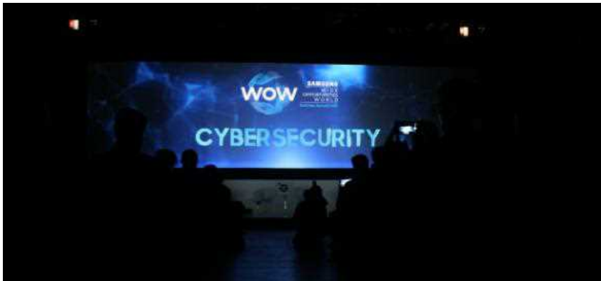
Samsung Business Summit, The Mall, Milano 26 ottobre 2017

Curato da Maurizio Ribechini | Pubblicato il: 27 ottobre 2017