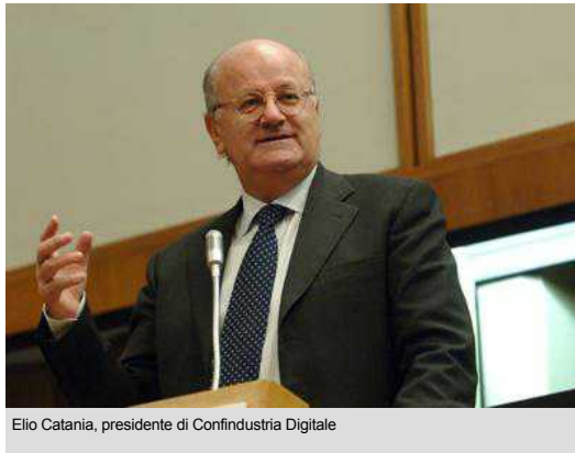
Elio Catania, presidente di Confindustria Digitale