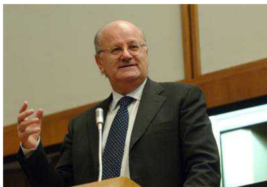
Elio Catania, presidente Confindustria Digitale