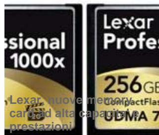
Lexar: nuove memory card ad alta capacità e prestazioni