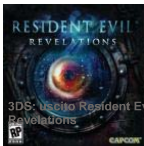
3DS: uscito Resident Evil Revelations