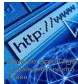
Governo, ecco l'Agenda digitale per il nostro Paese