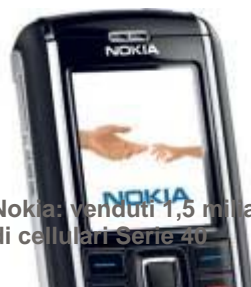
Nokia: venduti 1,5 miliardi di cellulari Serie 40